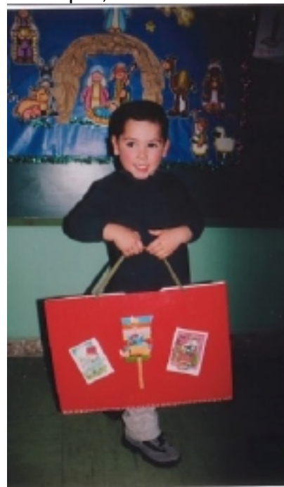
¡Hoy me toca a mí!