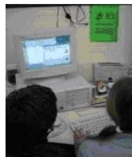
Alumnos del C.R.A. frente a las pantallas del ordenador en plena faena.

fundamental de esta herramienta es que nos permite trabajar a tiempo diferido, de tal forma que el receptor puede recibir los mensajes cuando se conecte a la red. No es necesario trabajar simultáneamente y si un día no funciona el servidor, ya lo haremos al día siguiente