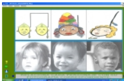
Figura nº3: Asociación entre las protagonistas de nuestra historia y las fotografías que representan las etnias