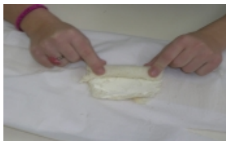
Paso 3: enrollar el pan