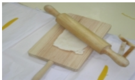
Paso 1: amasar el pan bimbo