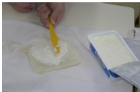
Paso 2: untar el queso