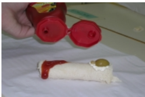
Paso 5: echar el ketchup