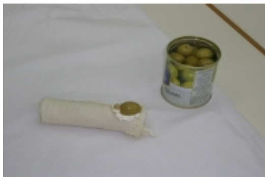
Paso 4: pegar la aceituna con queso