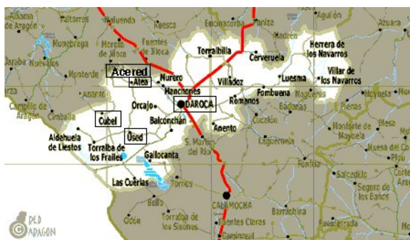
Comarca "Campo de Daroca"