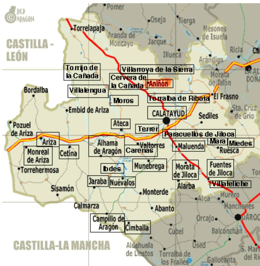
Comarca "Comunidad de Calatayud"